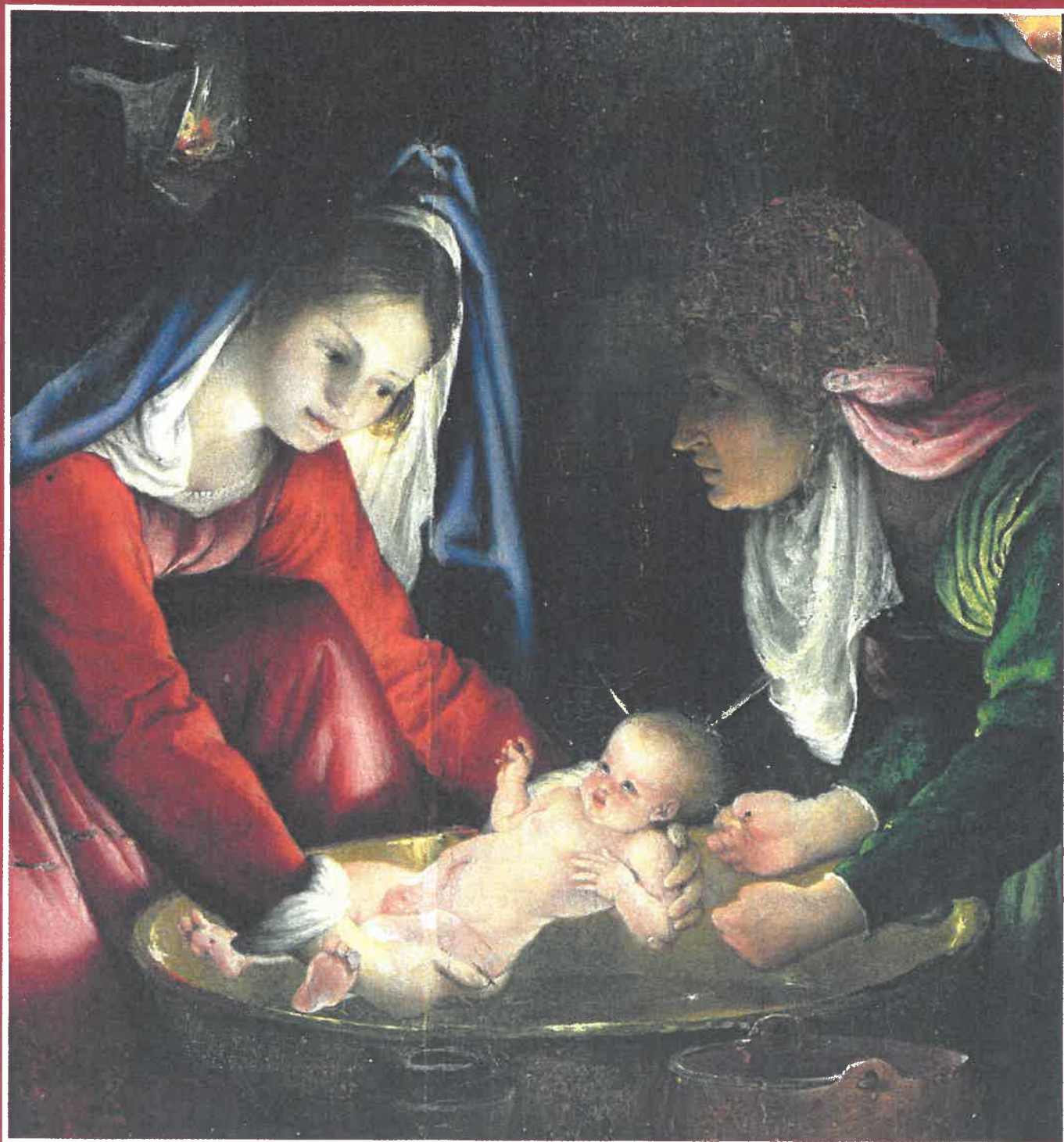
Gottes Liebe hat Hand und Fuß. Lorenzo Lotto / Pinacoteca Nazionale, Siena /